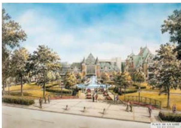
Au coeur de la nouvelle place de la Gare du Palais, l'oeuvre fontaine de Charles Daudelin.