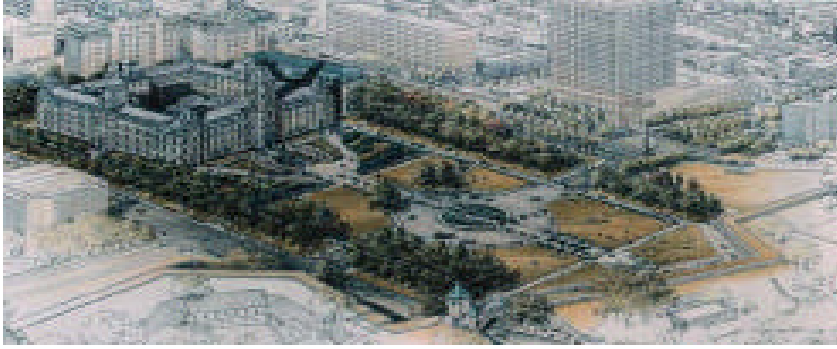
L'ensemble du secteur d'intervention prévu au plan directeur tel qu'interprété par l'illustrateur Benoit Gauthier.

La première phase est évaluée à quelque 4 M $ et sera pour l'essentiel assumée par la Commission de la capitale, gestionnaire de l'espace public situé à l'est de l'avenue Honoré-Mercier. L'état des lieux nécessitait déjà des investissements importants en ce qui a trait à la réfection de la voie publique et des trottoirs, laquelle aurait nécessité tôt ou tard la réalisation d'un programme substantiel de travaux publics.